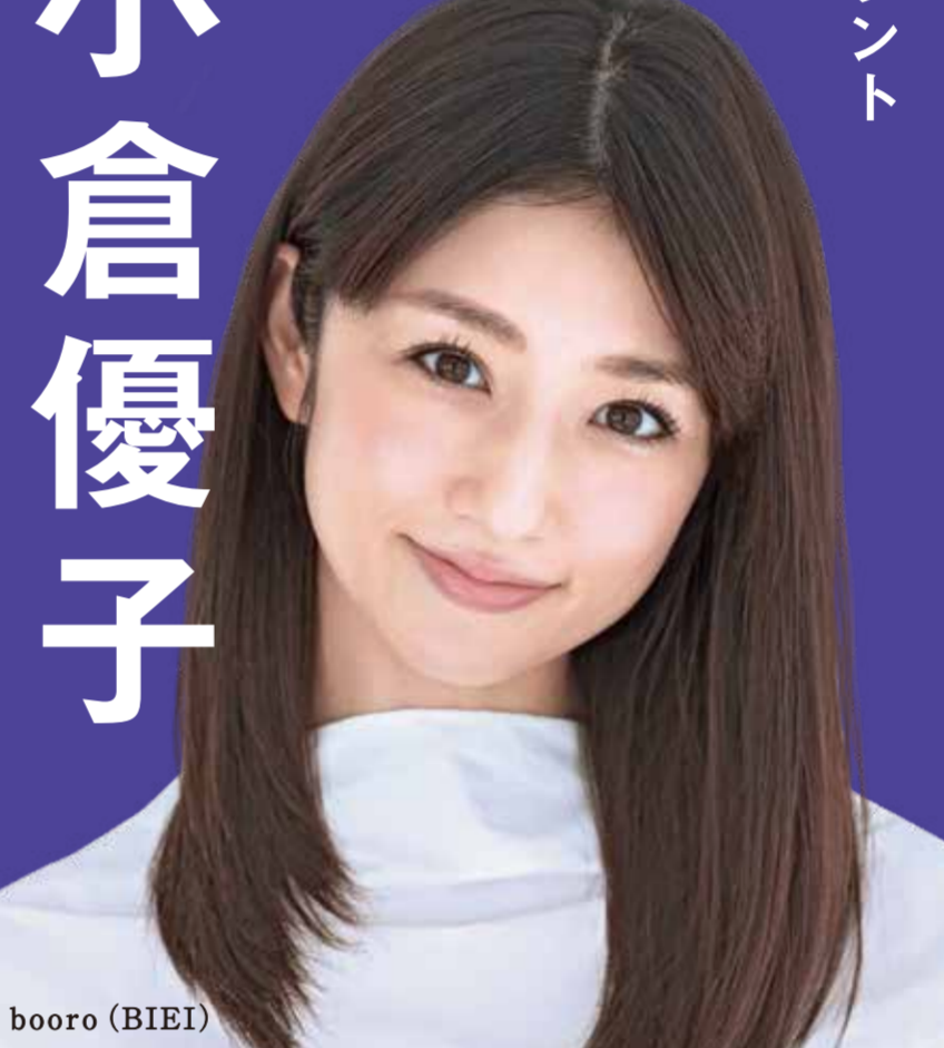
第7の習慣：小倉優子 [ISBN 978-4-86394-090-1]