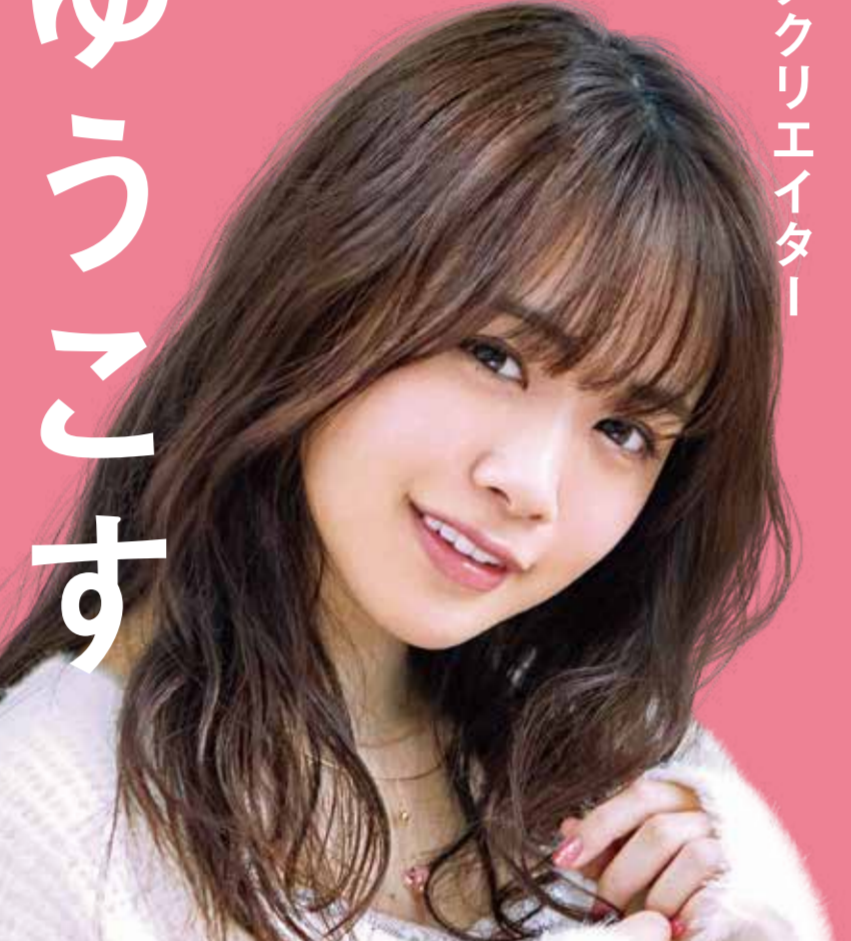
第4の習慣：ゆうこす [ISBN 978-4-86394-087-1]